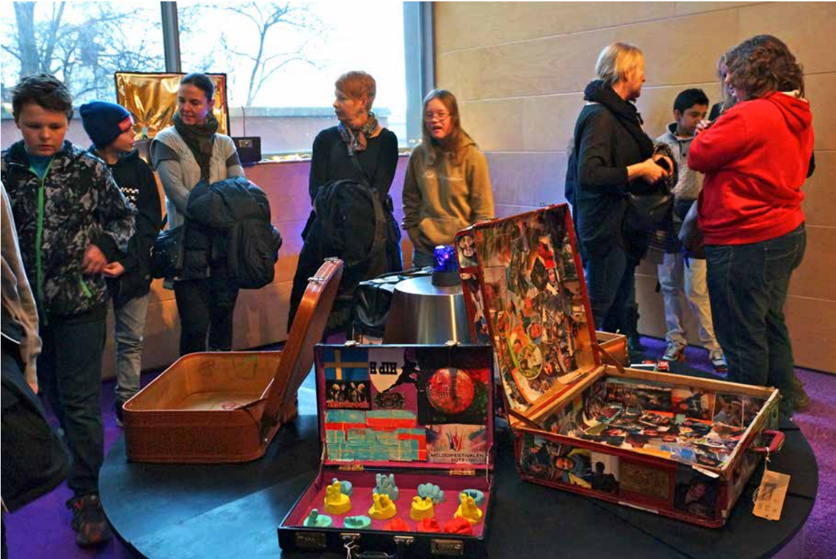
Alla har sin egen berättelse. På Moderna Museet i Stockholm visade 23 konstnärer upp sina berättelser i väskor.

23 ungdomar och unga vuxna hade gjort en väska var. I väskan fanns berättelser, minnen och saker som utställarna tyckte om att visa upp.